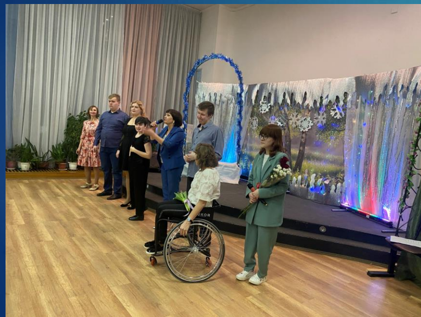
Концерт вокальной ИТЛ