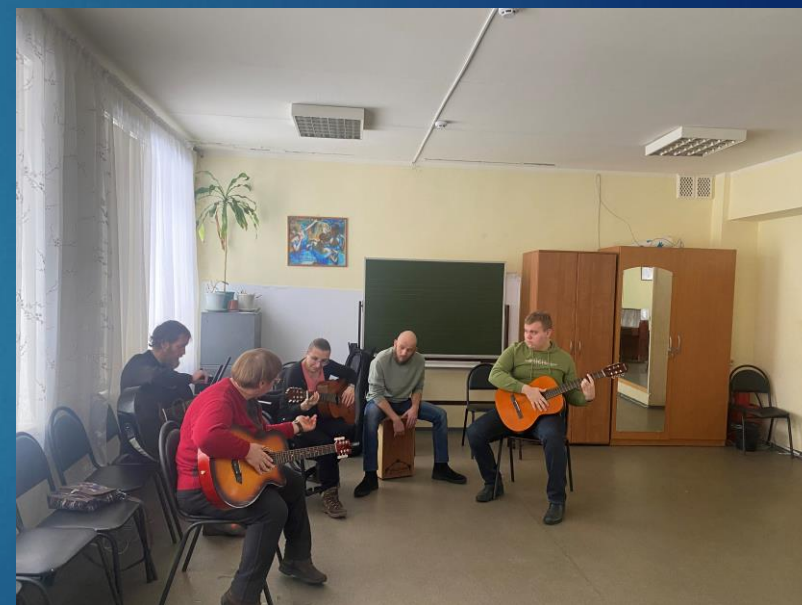
Открытый урок музыки